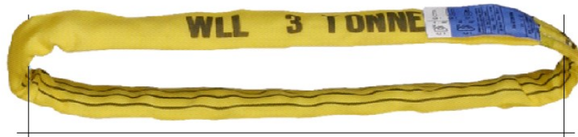
Longueur utile / Effective working length

Normes Coefficient de sécurité : 1:7 Conforme à la norme EN 1492-2+A1 Standards Safety factor : 1:7 Complies with EN 1492-2+A1 standard