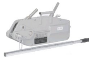
Réf. / Code : 200 660