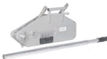
Réf. / Code : 200 659