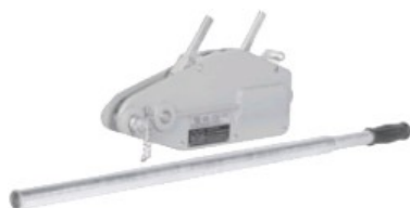
Réf. / Code : 200 661