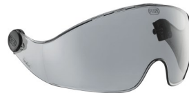
Visière de protection / Protective eye shield