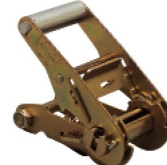
Réf. / Code 200 098