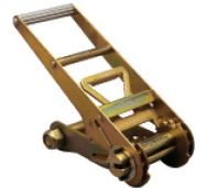
Réf. / Code 200 101