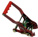
Tendeur à desserrage progressif Progressive release ratchet buckle