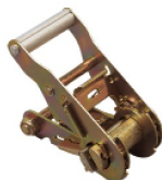
Réf. / Code 200 096