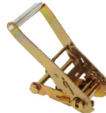
Réf. / Code 200 099