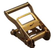
Réf. / Code 200 097