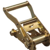
Réf. / Code 200 095