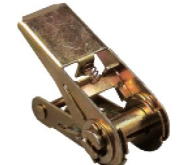
Réf. / Code 200 094