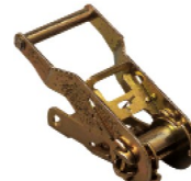
Réf. / Code 200 093