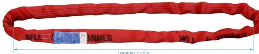
Longueur utile / Effective working length

Normes Coefficient de sécurité : 1:7 Conforme à la norme EN 1492-2+A1 Standards Safety factor : 1:7 Complies with EN 1492-2+A1 standard