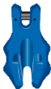
Griffe de raccourcissement GR 100 / Eyehook E GR 100