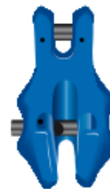
Griffe de raccourcissement à chape avec verrou CL GR100 / Celvis hook CL GR100