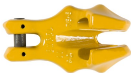
Griffe simple / Simple clutch