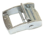
Réf. / Code 200 060