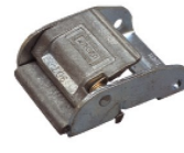
Réf. / Code