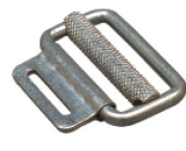
Réf. / Code 200 054