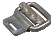
Réf. / Code