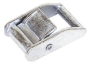
Réf. / Code 200 059