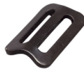
Réf. / Code 200 055