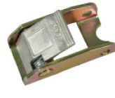
Réf. / Code