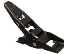
Réf. / Code