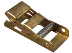
Réf. / Code