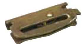
Crochet pousoir E-track fitting