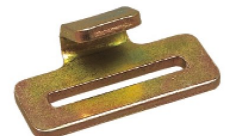
Crochet intérieur plat Flat hook